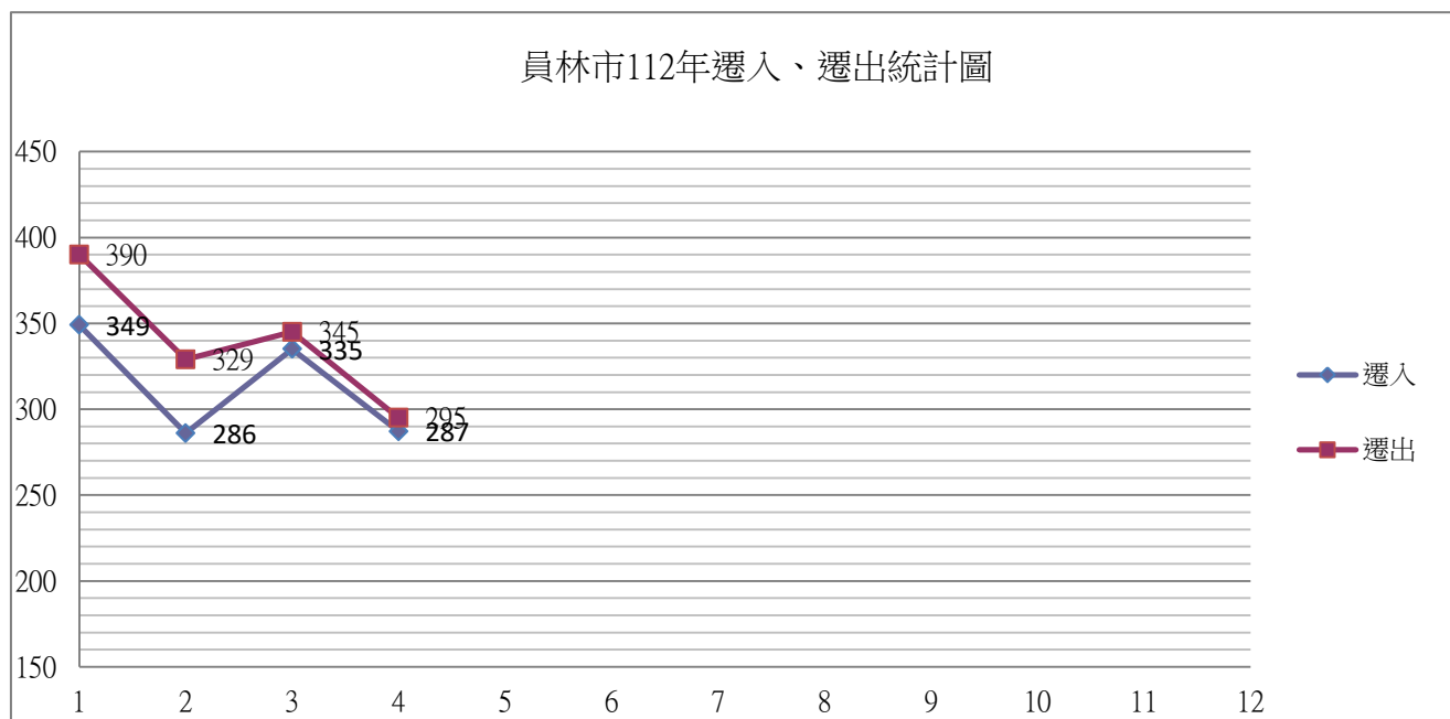
員林市112年遷入、遷出統計圖