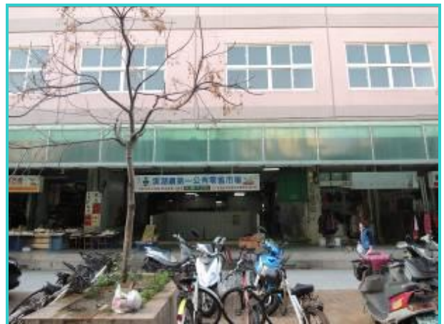
溪湖鎮第一公有零售市場