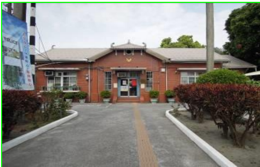
忠覺派出所(日據時期之建築)

忠覺(中角)地名源於聚落位於崙仔脚庄中央而取名「中角」，雅稱「忠覺」，本里東以後溪巷與大庭里相鄰，西以彰水路與大竹里相連，南與媽厝里相連，北與西溪里相接。以種植水稻、葡萄、蔬菜等為主要經濟活動，里內分為中角、尾厝、下厝等聚落，以陳姓居民為多數。