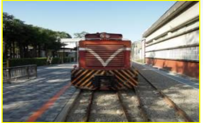
溪湖糖廠的觀光五分車