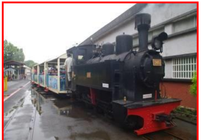
346 號五分車蒸氣火車頭