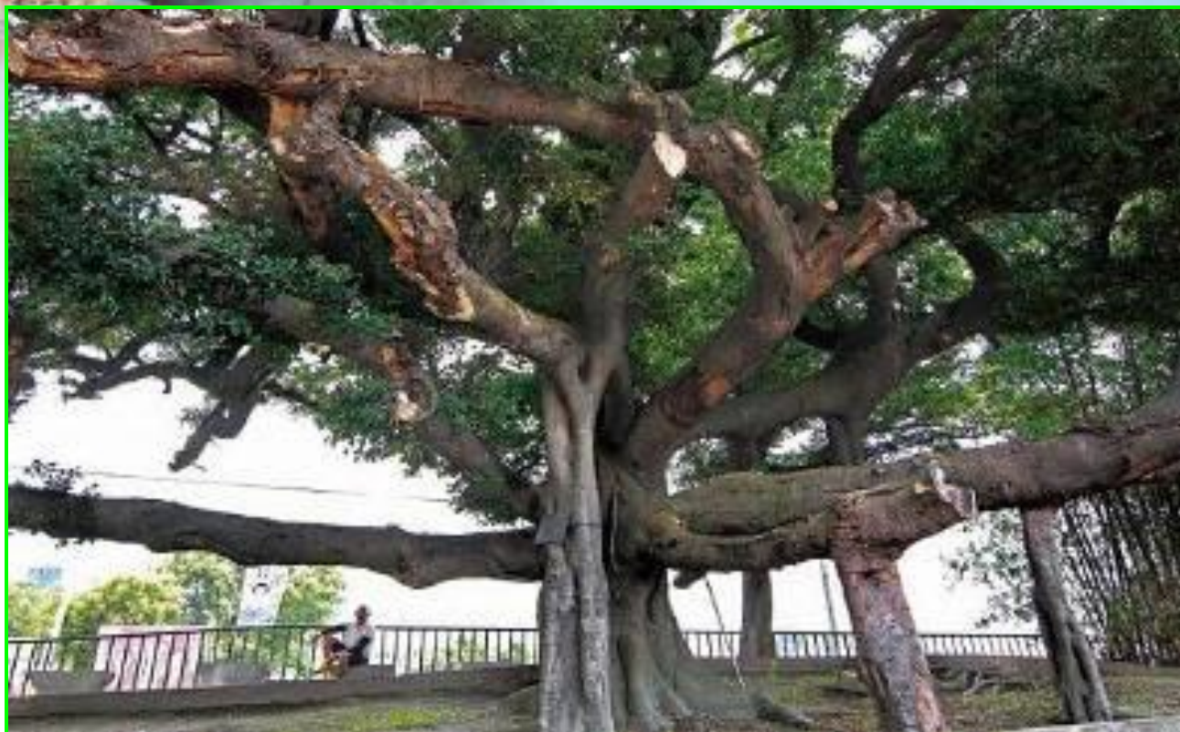
130 年樹齡的榕樹(Bischofia javanica)