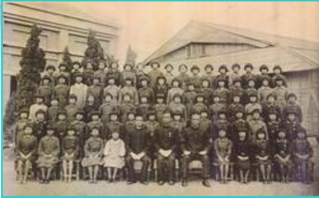
〈昭和 31 年〉左邊建物為現今之禮堂