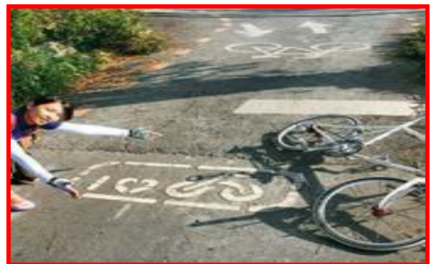
東螺溪自行車道路面上的「我愛單車」圖案相當可愛！