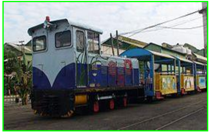
溪湖糖廠是臺灣唯一仍使用日立牌內燃機火車的糖廠