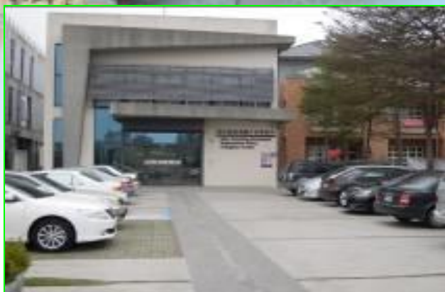
溪湖鎮戶政事務所